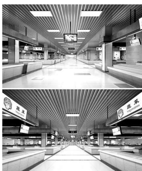
新建的市中心菜场内部效果图。