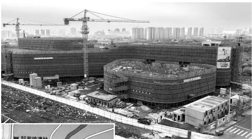
正在新建的市中心菜场。

为了让市民吃得放心、吃得安心,体现出智慧监管,市场服务中心将在每个摊位前放置显示屏,显示经营户个人信息。与此同时,采价显示屏、检测公示等都将放置在市场的显眼位置。