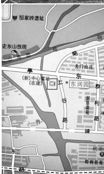
新建的市中心菜场位置。