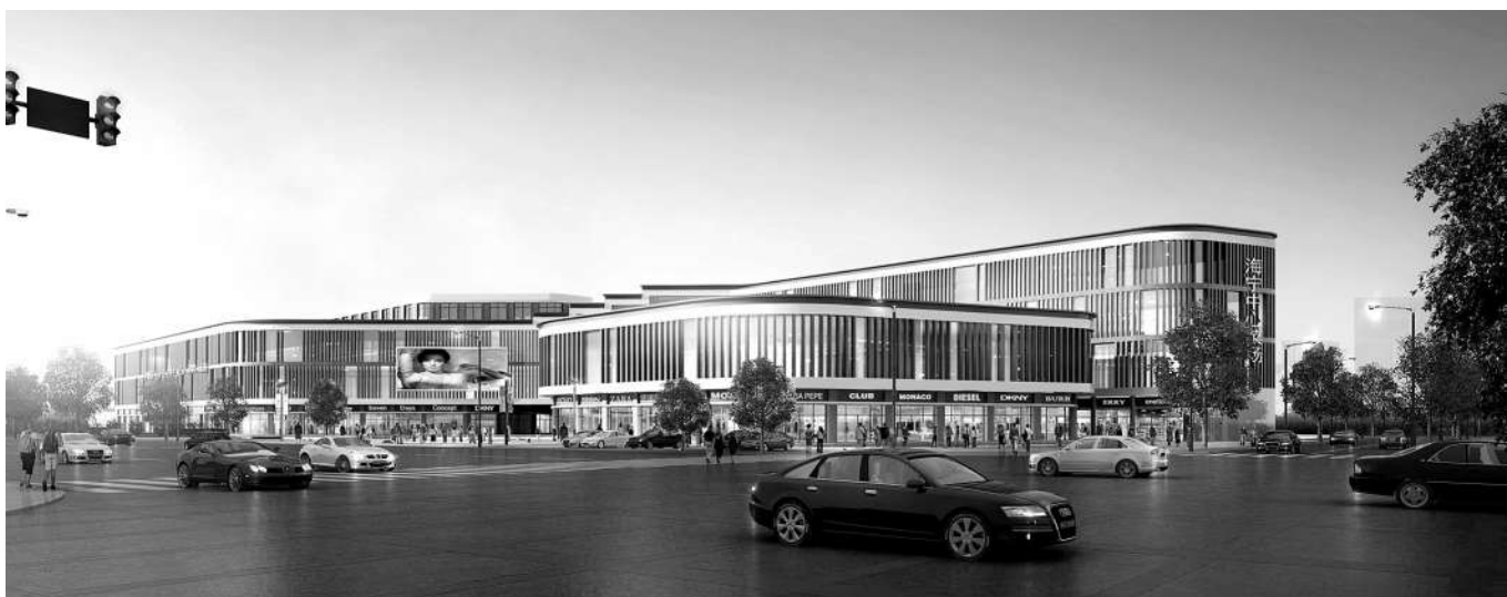
新建的市中心菜场效果图。

海宁市市场开发服务中心相关负责人告诉记者,未来这里将建成集农贸市场、餐饮美食、小商贸、办公等为一体的农贸综合体,计划于2019年6月投入使用。